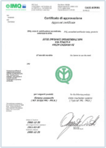
certificazione di prodotto IMQ "PFLR/PFL"