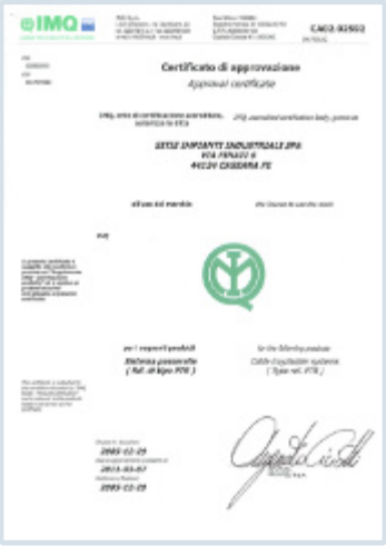
certificazione di prodotto IMQ "PTR"